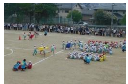
3年 頭上に気をつけろ! 「ディスタンスハリケーン」