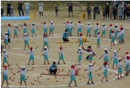
1年「Bバンバン T玉入れ S.勝利を目指せ!!!」

5月21日(土)に令和4年度の運動会を実施しました。今年は練習の段階から天候に恵まれ、子供たちはこれまでの練習の成果を存分に発揮することができました。たくさんの方々から心温まる応援をいただきありがとうございました。