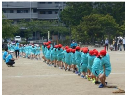
5年「はじめてのつなひき」