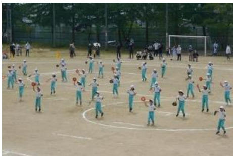
4年「羽ばたけ!ハ乙女すずめ!」