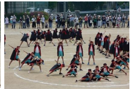
6年「躍動!ハ乙女ソーラン2022」